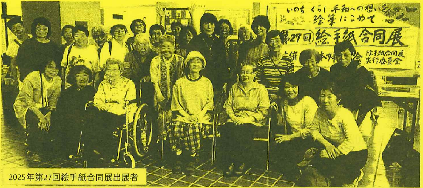
2025年第27回絵手紙合同展 出展者