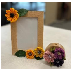
⑩⑪「洋風つまみ細工」 右:ペン立て 左:「写真立て」