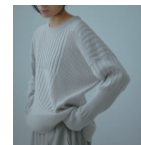
近藤ニット (evam eva) Kondo Knit (evam eva)