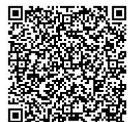
電子申請用QRコード