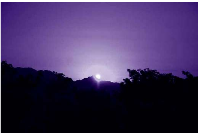
甲斐駒に沈む夕日

例えば県立科学館からは、毎年ゴールデンウィークのころ、ちょうど甲斐駒ヶ岳のあたりに夕日が沈む様子を見ることができる。特徴的な山頂の尖ったところに、太陽がぴったり刺さっていくように沈む瞬間に出会えると、なんだか特別な場面に立ち会ったようで、胸が弾む。しかし一日でもずれると、もう太陽は山頂に刺さる姿を見せることなく、斜面を滑り降りながら沈んでゆく。さらに日が進めば、数日後にはもう隣の山へ……。