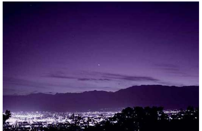
科学館から見た金星

今年は今後、夏から秋にかけて、日没時の金星の高度は徐々に低くなり、見える方角も少しずつ南寄りへ移動していく。そんなことを気にかけると、きっとあなたも、夕方になると西の空で金星の見え方が気になって、そわそわしてしまうようになるだろう。