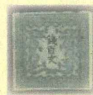
日本初の切手(龍切手) (個人蔵)

◆日時：令和6年 7月27日(土) 13:30～15:30 (受付：13:00から)