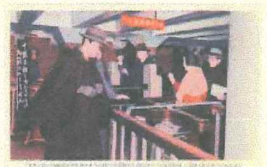
日本初の地下鉄 (東京地下鉄道は自動改札も日本初) (個人蔵)