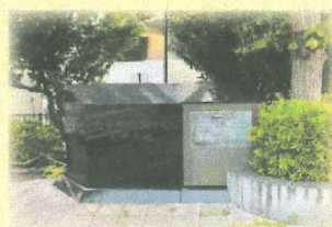
民間機械製粉業発祥の地碑