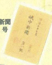
山梨はじめての新聞 「映中新聞」第1号 (山梨県立博物館蔵)