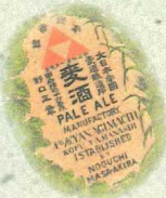
三ツ鱒ビールのラベル (山梨県立博物館蔵)

わが国の郵便制度を立ち上げた杉浦譲や、 日本で最初の地下鉄を実現させた早川徳次など、 第19回展示「やまなしはじめて人物博覧会」