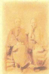
横浜横港使節としてフランスに渡った 杉浦譲(右)・田辺太一(左)

にてご紹介している人物を中心に、 山梨や日本で最初の取り組みの数々と 人々の軌跡についてご紹介いたします。