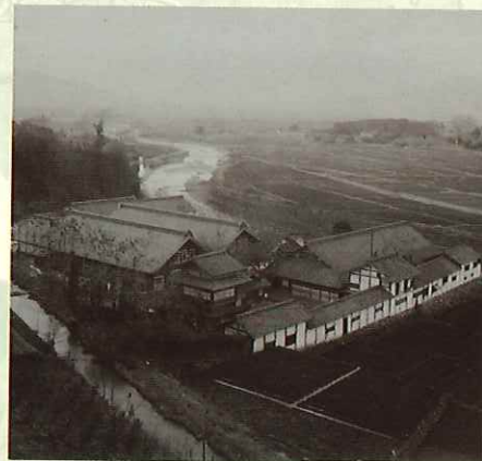
渡辺青洲によって建設された市川紡績所 (市川三郷町) 個人蔵