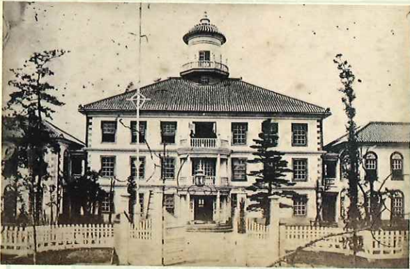
微典館の流れを汲んだ県師範学校 山梨県立博物館蔵(甲州文庫)