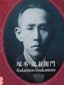
塚本 定右衛門 Sadaemon Tsukamoto