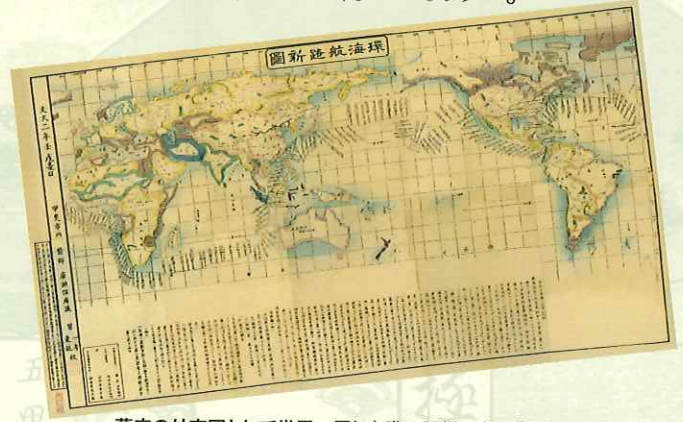
幕府の外交団として世界一周した際の記録である「環海航路新図」

幕領だった山梨は江戸幕府の影響が強い地域でした。そのため、甲府には江戸の昌平坂学問所に次いで甲府学問所(微典館)が設置され、多くの山梨の人々に高い教育機会がもたらされる基礎となりました。また、幕末においては幕府が派遣する外交団に選出される人々も多く輩出し、明治時代以後の日本の近代化を支える多くの人材を育む土壌ともなったのです。