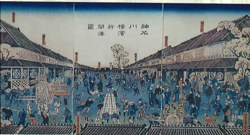
甲州商人も出店した横浜の開港場の賑わいを描いた「神名川横浜新開港図」 山梨県立博物館蔵

山梨は江戸(東京)や外国への窓口となった横浜と近接していることから、はやくから国際化や産業化の機運が高まった地域でした。近代化の息吹は山梨に新たな文化を育み、また山梨から新しい個性や生産物を発信する原動力となっていきました。