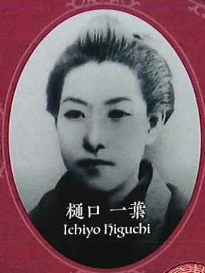
樋口 一葉 Ichijo Higuchi